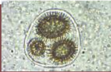
Esporas de marrón blanquecino a marrón claro, con espinas alargadas y esbeltas, translúcidas en la madurez

nera que la plantación tiene quemados pero produce otra trufa de menor calidad y precio. Es por ello que los protocolos españoles de control de planta micorrizada no permiten que se considere apto un lote con que aparezca una sola micorriza de esta especie.