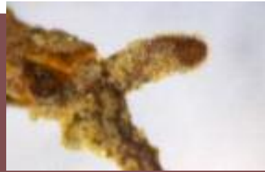
Micorrizas con ápices rectos inflados y cistidios en aguja, vistas al microscopio estereoscópico