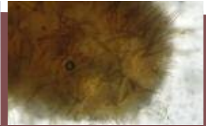
Cistidios en aguja con la base ensanchada y paredes gruesas, generalmente sin tabicar, vistos al microscopio biológico