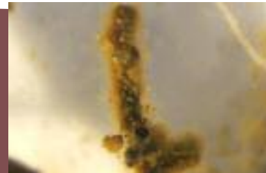
Micorrizas en crecimiento activo, con numerosos cistidios que forman una maraña, vistos al microscopio estereoscópico