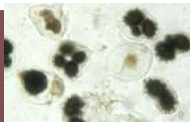
Esporas de marrón claro a marrón chocolate-negro, con espinas soldadas por la base y casi opacas en la madurez

Es una de las trufas más consumidas en el mundo pese a su escaso valor culinario. China exporta cada vez más toneladas de esta especie de tuber, cuyo precio en el mercado casi se ha triplicado en los últimos años aunque sigue muy lejos del valor de la melanosporum. Así, su precio oscila entre los 60 y los 80 euros.